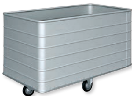
Тележка без перфорации