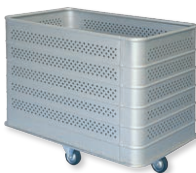
Тележка с перфорацией Ø 10 мм