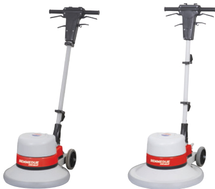
MS 20 FAST