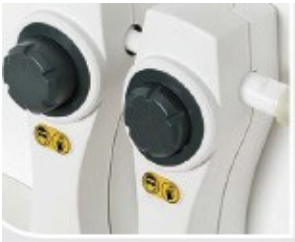
нажатие головки дозатора